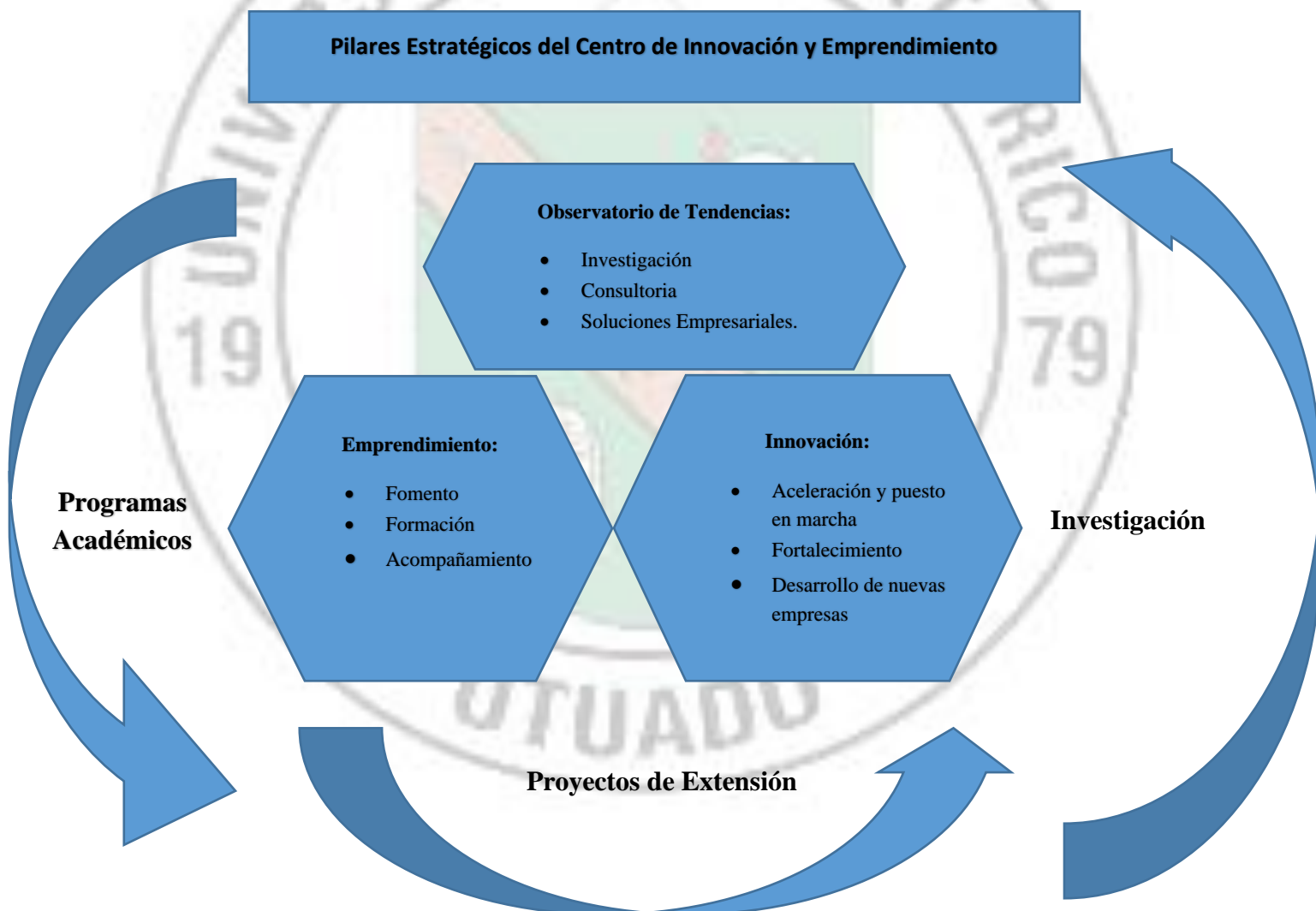
Figura 2: Pilares Estratégicos Centro de Innovación y Emprendimiento

A continuación, se describen cada uno de los pilares que integran el Centro.